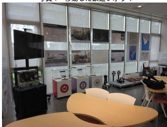
写真 2 オープンスペースの展示品