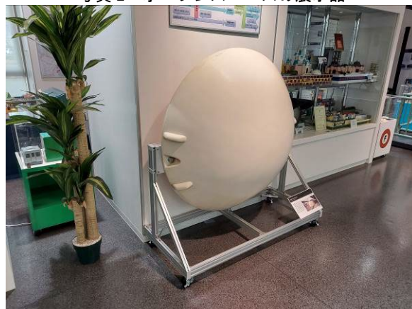
写真 3 展示土台に固定した 200 系新幹線ボンネット